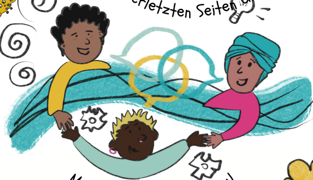
Illustration: Mariela Georgy